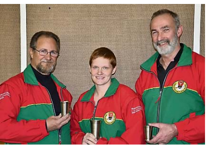
Das strahlende Siegertrio.

Am 14. April 2013 trafen sich die Sportschützen Suhr zu ihrem Frühlingscupschüssen auf der Schiessanlage Obersteln in Suhr. 13 Schützen und Schützinnen nahmen die erste Runde in Angriff.