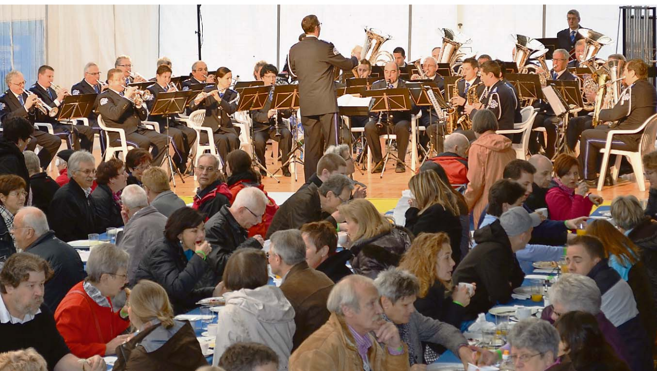
Rund 650 Personen geniessen das reichhaltige Frühstück am Matinee-Konzert des Polizeispiels.