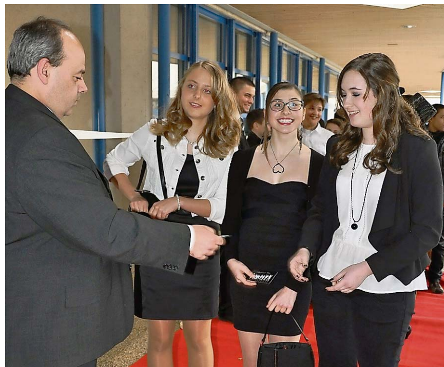
Nur wer ein Ticket vorweisen konnte, hatte Einlass.